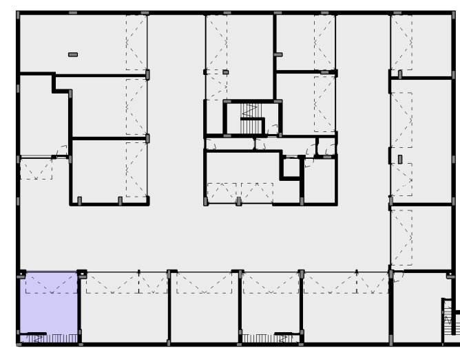
D - BOX / ESTACIONAMENTO 1:500

INTERIOR / HABITAÇÃO 175,80 M 2 EXTERIOR 122,10 M 2