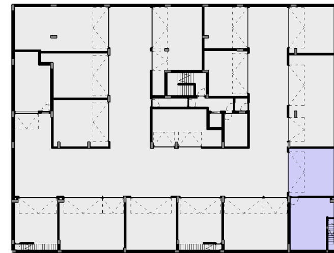
F - BOX / ESTACIONAMENTO 1:500

INTERIOR / HABITAÇÃO 177,00 M 2 EXTERIOR 158,10 M 2