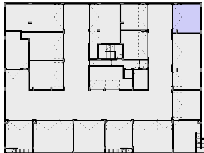
I - BOX / ESTACIONAMENTO 1:500

INTERIOR / HABITAÇÃO 133,00 M 2 EXTERIOR 27,00 M 2