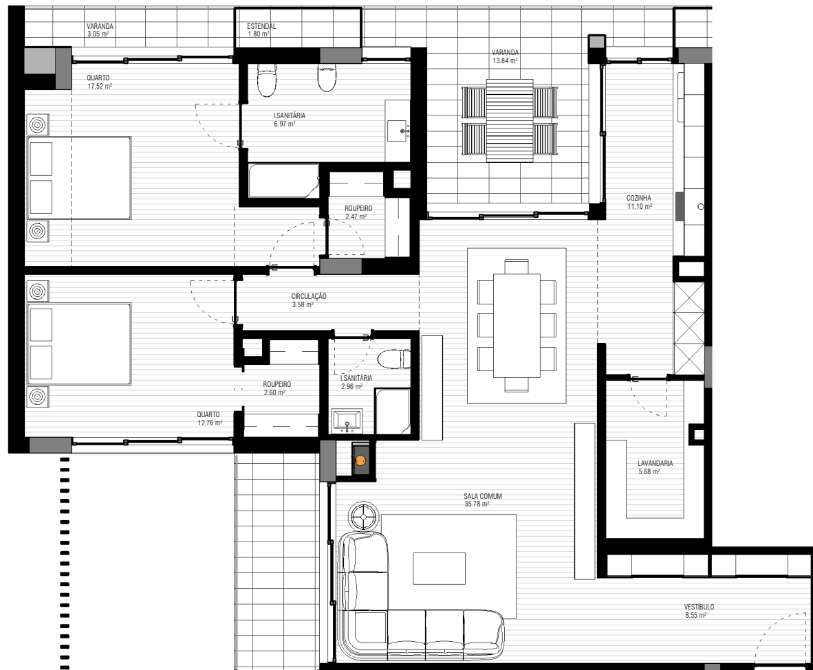
I - FRACÇÃO 1:100