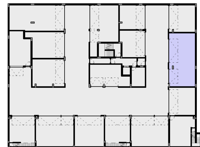
M - BOX / ESTACIONAMENTO 1:500