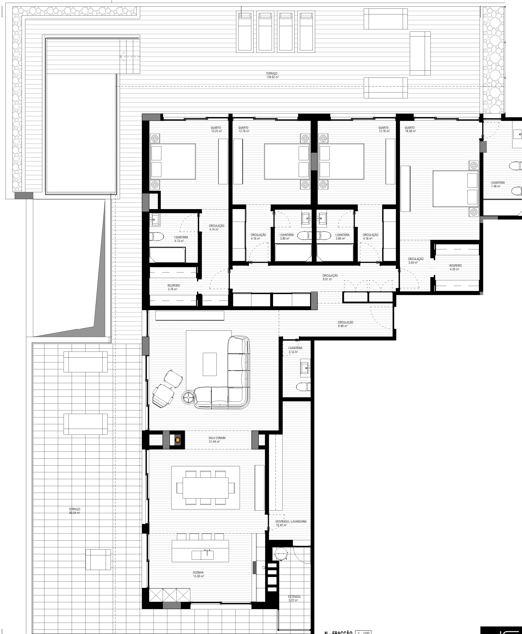
N - FRACÇÃO 1:100

INTERIOR / HABITAÇÃO 233,90 M 2 EXTERIOR 220,30 M 2