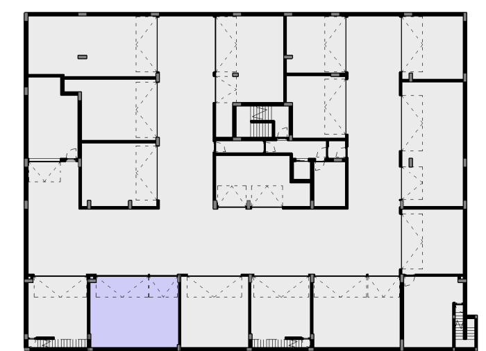
N - BOX / ESTACIONAMENTO 1:500