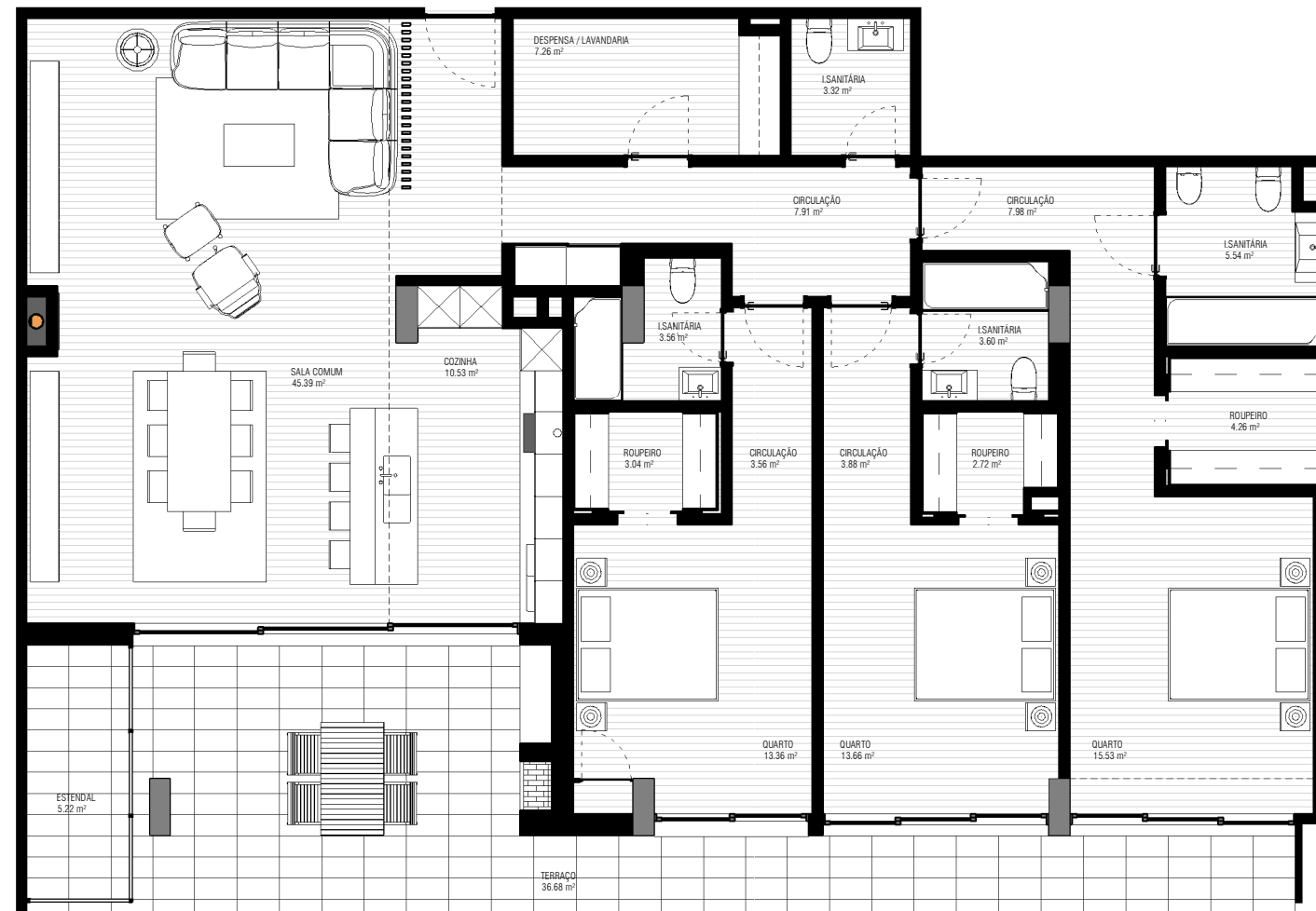
0 - FRACÇÃO 1 : 100